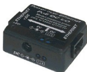
PoE DC I/O