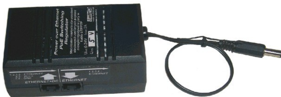
PoE Switching Regulator

PoE DC I/O wyposażony jest w dwa gniazda RJ45, jedno służy wprowadzeniu sygnału sieciowego, drugim zaś wyprowadzony jest sygnał sieciowy (1,2,3,6 gniazda RJ45) wraz z napięciem zasilania podłączonym do gniazda DC2.1/5.5 lub złącza śrubowego (4,5,7,8 gniazda RJ45, gdzie 4,5 jest „+” a 7,8 „-”, zasilania).